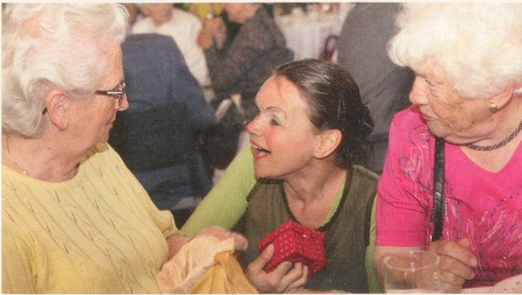
Wenn man 80 wird, so hat man was zu feiern! 22