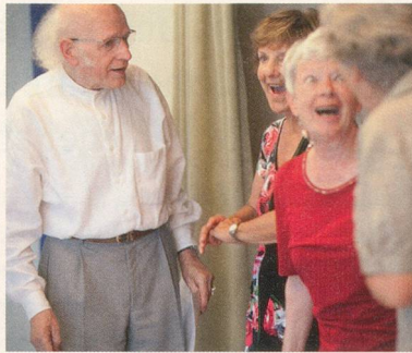
Auf der (Senioren-)Bühne 24