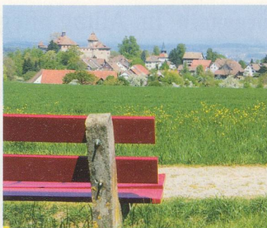
Wandern: Auf zur Kyburg 30