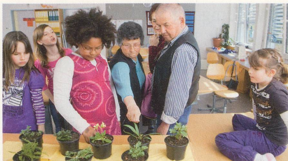
Kräuterkunde: Altes Wissen verzaubert junge Menschen 10