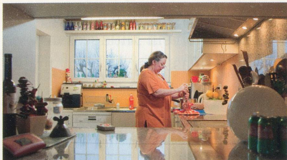
Mit Helen Rubli unterwegs zum Suppenzmittag 04