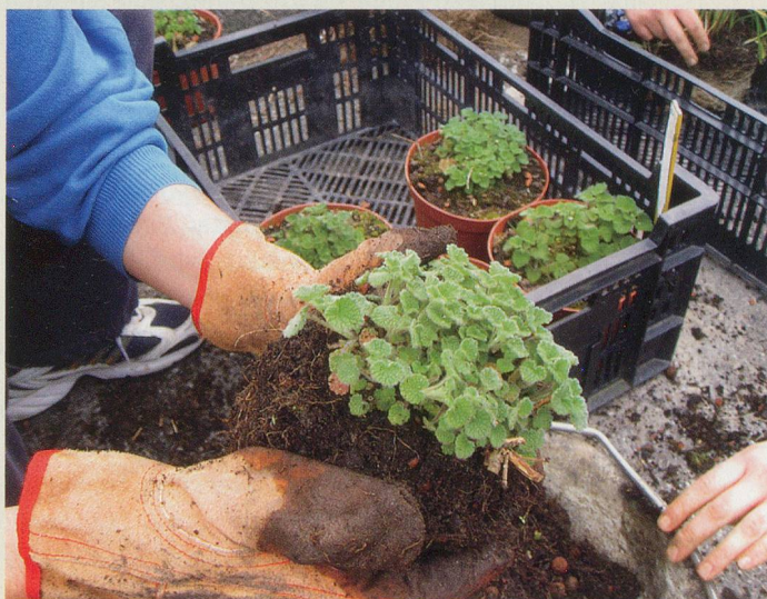
Im Projekt Kalkbreite wird dem gemeinschaftlichen Leben ein grosser Stellenwert zugemessen. Sozusagen geübt wird jetzt schon mit dem temporären Garten.