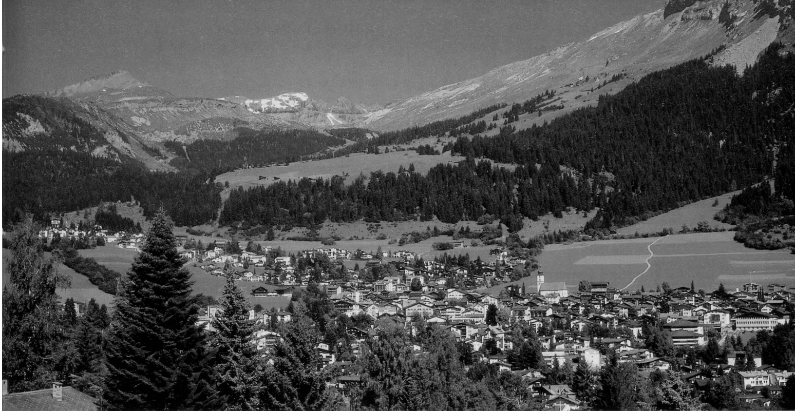
250 Kilometer ausgeschilderte Wanderwege und Themenpfade gibt es rund um Flims.