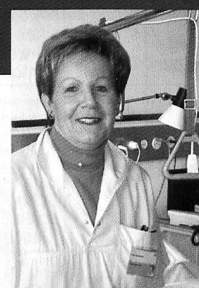
Frau Schneider Spital St. Gallen

„Als Stationssekretärin bin ich den gan- zen Tag auf den Beinen. Das strapaziert nicht nur meine Füße, sondern den gesamten Körper. Seit ich die Swiss- Energy-Walker Einlegesohlen trage, habe ich abends keine Rücken- und Beinbeschwerden mehr. Ausserdem spüre ich mehr Energie im Körper und fühle mich rundum vitaler.“