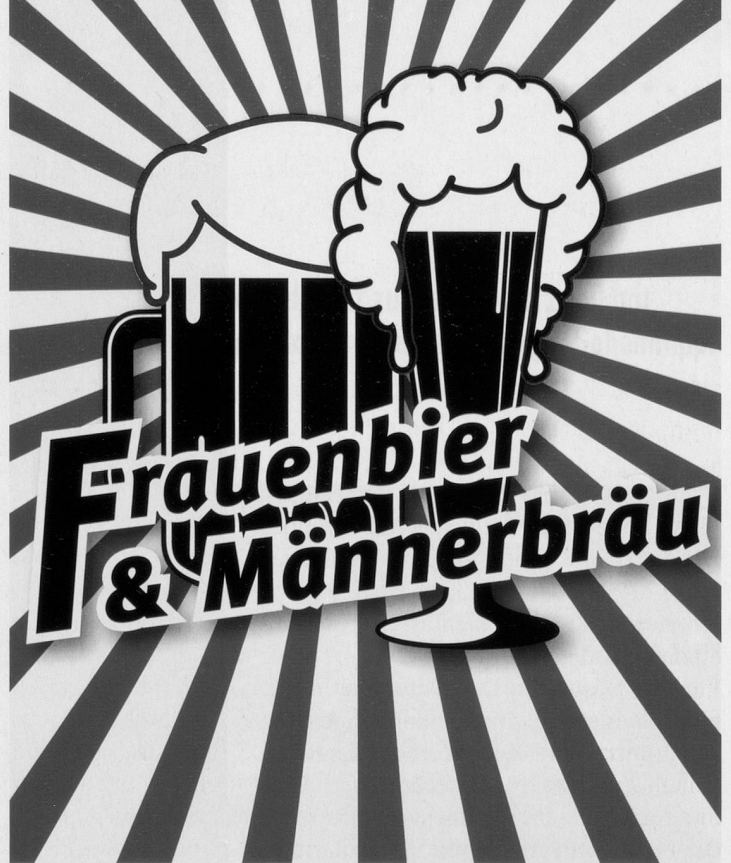
Kulturhistorische Ausstellung übers Bier: sie will speziell auch Frauen ansprechen, die traditionellerweise die Meisterinnen der Braukunst waren.

Doch wie wird Hirsebier in Burkina Faso gebraut? Was hat es mit dem Bierteufel auf sich? Woraus besteht eine Biersuppe? Macht Bier dick? Wie wird Rauschtrinken definiert? Weshalb müssen