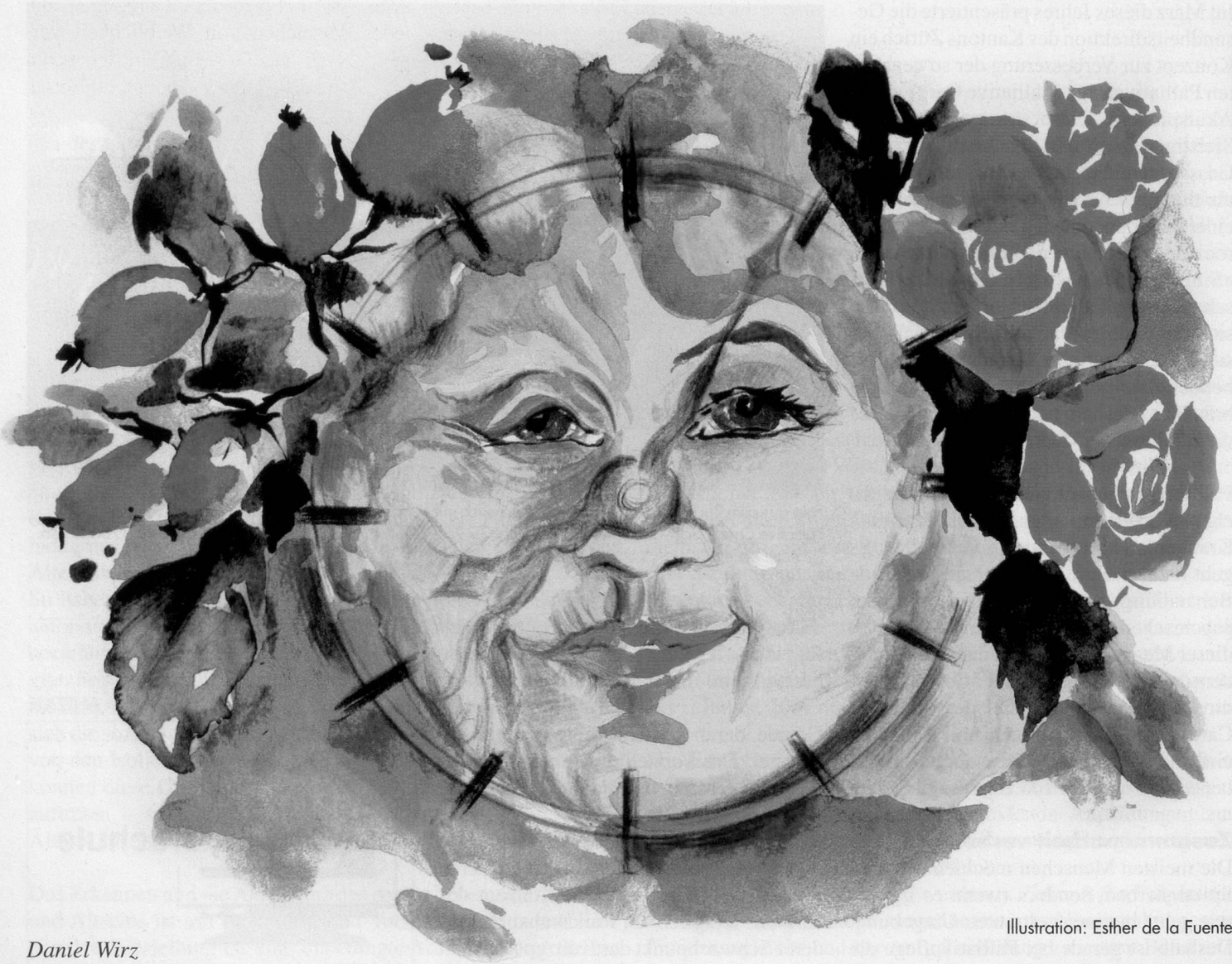
Illustration: Esther de la Fuente

Ist Schönheit für Sie ein Thema? Finden Sie sich schön, und wenn ja, was gefällt Ihnen am besten an sich? Täglich werden wir über Medien und Werbung mit Schönheit konfrontiert – eigentlich etwas durchaus Erbauliches, wenn es nicht so viele von uns unter Druck setzen würde, mit all diesen Schönheiten mithalten zu müssen. In diesem Beitrag (und den weiteren Artikeln zum Schwerpunktthema dieses «visits») wollen wir uns deshalb etwas genauer mit dem Thema Schönheit auseinandersetzen.