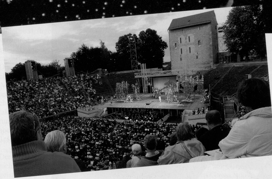
Die Arena in Avenches bietet einen würdigen Rahmen zu Bizets «Carmen».