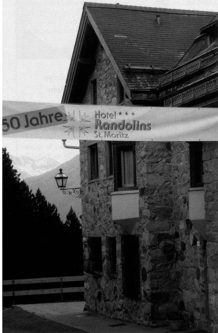
Das Dreierstern-Hotel Randolins in St. Moritz liegt mitten im herrlichen Wander- und Skigebiet am schönsten Engadiner Südhang.

Randolins ist nicht nur ein gemütliches und komfortables Ferienhotel im St. Moritzer Suvretta-Gebiet. Als Evangelisches Zentrum für Ferien und Bildung will Randolins Familien, Einzelgästen und Gruppen Ferien und Kurse zu guten Preisen anbieten. Das Hotel Randolins, welches eben seinen 50. Geburtstag feierte, freut sich über viele zufriedene Stammgäste, die dem Haus die «Goldmedaille» zusprechen.