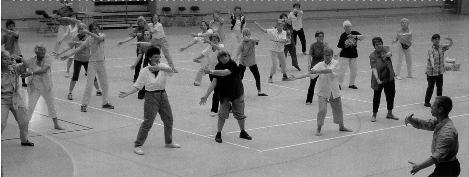
In Schnupperlektionen konnten Interessierte verschiedene Sportarten direkt ausprobieren.

einsamung alter Menschen. Gruppen und Kurse sind Orte der Begegnung. Es werden automatisch neue soziale Kontakte geknüpft. Freundschaften entstehen, soziale Bindungen wachsen. So kann sich jeder bis ins hohe Alter ein Fundament für Gesundheit und Wohlbefinden legen, nicht nur körperlich, sondern auch seelisch, geistig und sozial. Ganz nach dem Credo des Seniorensports «Bewegen – Begegnen – Begreifen – Behalten», wird der bewegungskulturelle Lebensstil, welcher sich bei den Senioren von heute etabliert hat, gefördert.