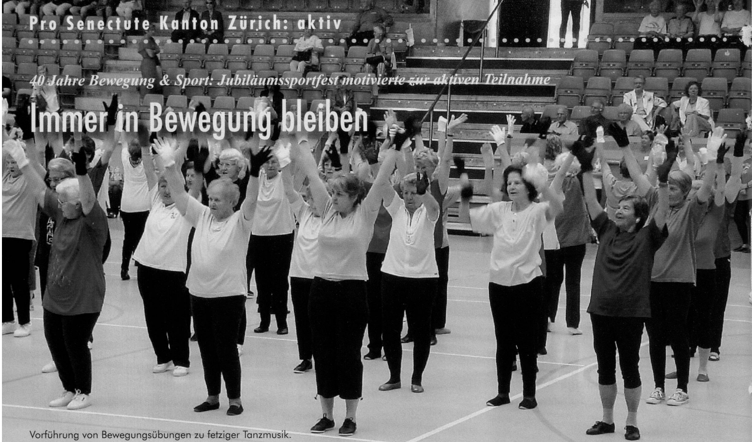
Vorführung von Bewegungsübungen zu fetziger Tanzmusik.