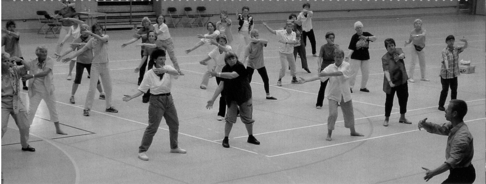
In Schnupperlektionen konnten Interessierte verschiedene Sportarten direkt ausprobieren.

einsamung alter Menschen. Gruppen und Kurse sind Orte der Begegnung. Es werden automatisch neue soziale Kontakte geknüpft. Freundschaften entstehen, soziale Bindungen wachsen. So kann sich jeder bis ins hohe Alter ein Fundament für Gesundheit und Wohlbefinden legen, nicht nur körperlich, sondern auch seelisch, geistig und sozial. Ganz nach dem Credo des Seniorensports «Bewegen – Begegnen – Begreifen – Behalten», wird der bewegungskulturelle Lebensstil, welcher sich bei den Senioren von heute etabliert hat, gefördert.