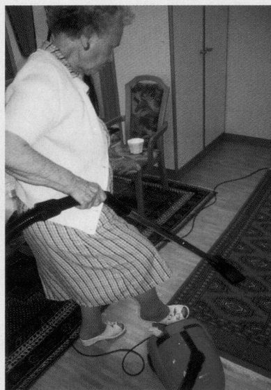
Selbständig in der eigenen Wohnung, dank angepasster Wohnform.

Auskünfte zur Pro Senectute-Wohnberatung/Wohnungsanpassung: Telefon 01 421 51 34.