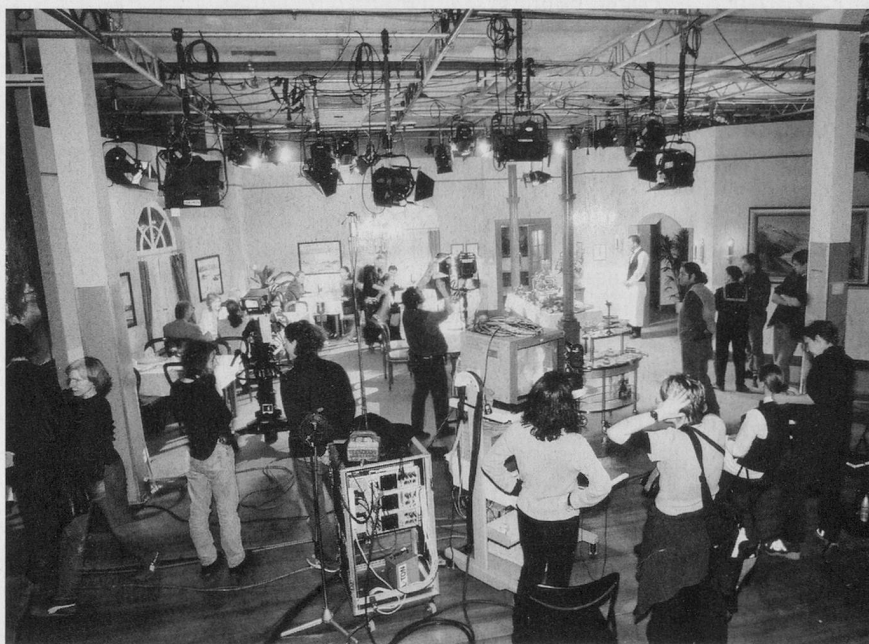
Fernsehluft schnuppern beim Besuch der Produktionsstudios.

kundiger Führung wird den Besucher/innen klar, wie viele Details stimmen müssen, damit die abendliche Fernsehunterhaltung in die Wohnzimmer flimmert.