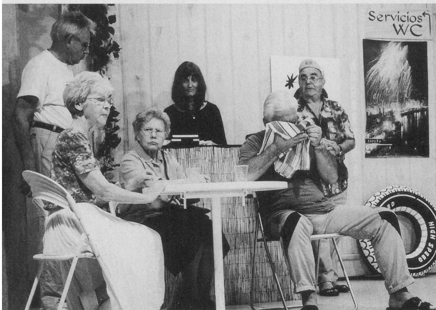
Seit 27 Jahren erfolgreich ... die Seniorenbühne Zürich hat über 1000 Aufführungen bestritten.