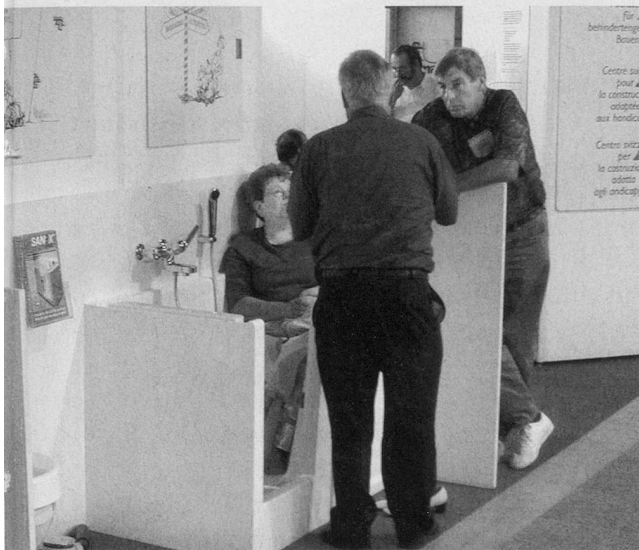
Alters- und behindertengerechtes Bauen: vom 29. August bis 2. September 2002 an der Messe Zürich fachliche Auskunft zu Hilfsmitteln und Wohnungsanpassungen.

muss die Spitex für die Körperpflege kommen, aber eigentlich würde sich Frau G. gerne wieder selber waschen. Nach der Besichtigung vor Ort schlugen die Mitarbeitenden der Fachstelle folgende Massnahmen vor: