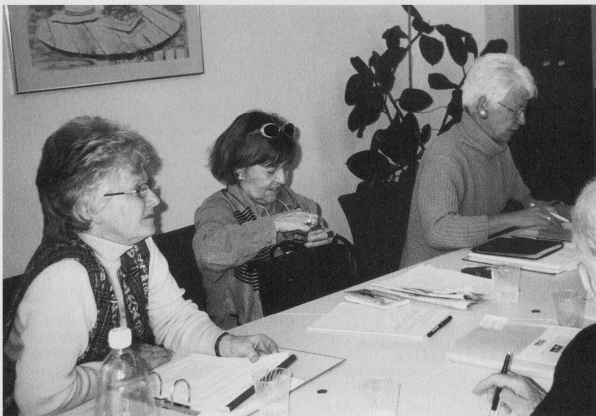
Der SeniorInnenrat Zürich SRZ: vertritt die Anliegen der älteren Bevölkerung in der Öffentlichkeit.

Kein Zweifel: Unter den selbstorganisierten Seniorengruppen von Pro Senectute Zürich nimmt der SeniorInnenrat Zürich eine bedeutungsvolle Stellung ein, handelt es sich doch um eine eigentliche Denkzentrale. Ziel des SeniorInnenrates ist es, die Anliegen der älteren Bevölkerung des Kantons und der Stadt Zürich in der Öffentlichkeit zu vertreten. Themen dafür gibt es unzählige, schliesslich sind Senior/innen in allen Lebensbereichen präsent.