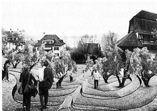
Die Schweiz, Idylle des Friedens: Der «Garten der Gewalt» thematisiert, was im Verborgenen Angst bereitet.