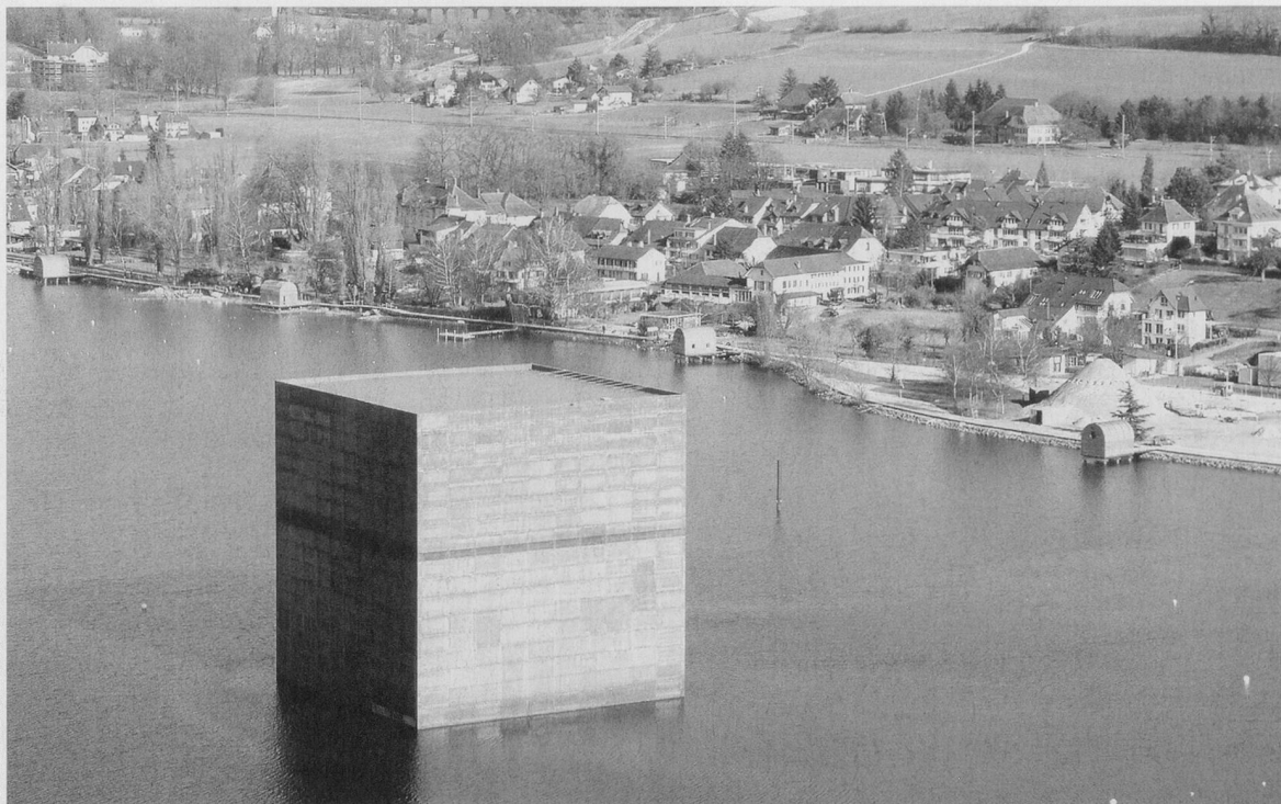
Mit dem Schiff zum Monolithen: Wahrzeichen der Arteplage Murten und Symbol für die Vergänglichkeit.