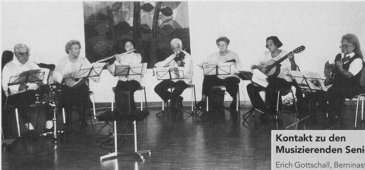
FOTO MUSIZIERENDE SENIOREN ZÜRICH

Idealbesetzung wären 12 Musizierende: Zum Wohlklang für alle werden begeisterte Musiker/innen gesucht.