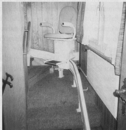
Der Einbau eines Treppenliftes oder ...

laufes und das Aufbringen von rutschhemmenden Streifen an den Stufenvorderkanten im Treppenhaus die Unfallsicherheit schon beträchtlich steigern. Der Alltag kann entweder durch den Einsatz von Hilfsmitteln oder durch bauliche Massnahmen erleichtert und sicherer gemacht werden, um eine Wohnung möglichst optimal an die Bedürfnisse des älteren Menschen anzupassen.