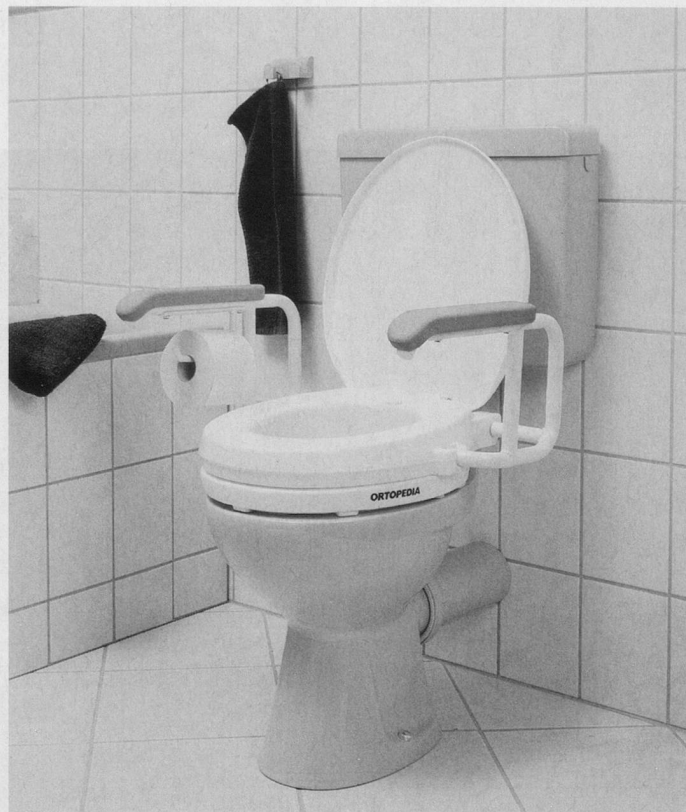
Haltegriffe im Bad, bei der Toilette, erhöhte Sitzflächen für mehr Sicherheit im Alltag.

Handwerker müssen kontaktiert und Kostenvoranschläge kontrolliert werden. Und dann stellt sich die Frage, wie die geplanten Massnahmen finanziert werden sollen. Bei all diesen Schritten berät und unterstützt die Fachstelle Wohnungsanpassung/Wohnberatung in Zusammenarbeit mit der Sozialberatung, beides Dienstleistungen von PSZH, ältere Menschen im gesamten Kantonsgebiet.