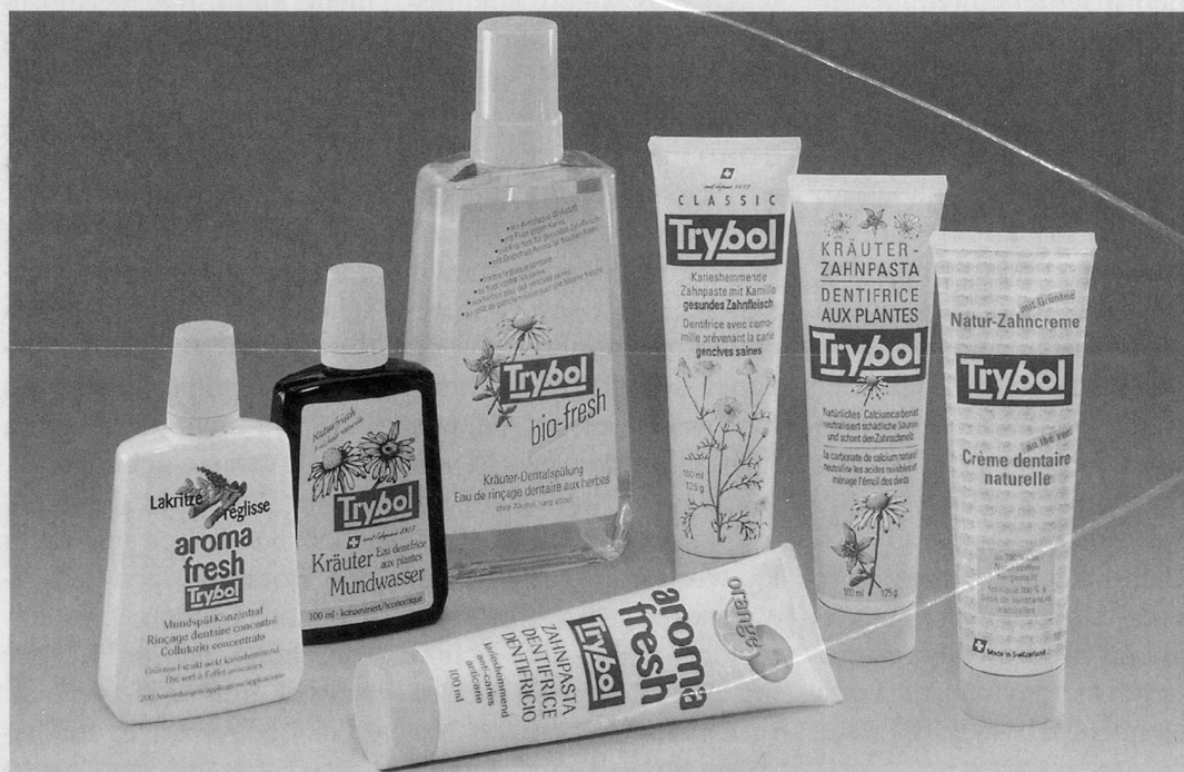
Das Trybol-Mundpflegesortiment: Eine breite Palette von verschiedenen, natürlichen Produkten.

Die Trybol Mundpflegeprodukte wie das Original Trybol-Kräuter Mundwasser