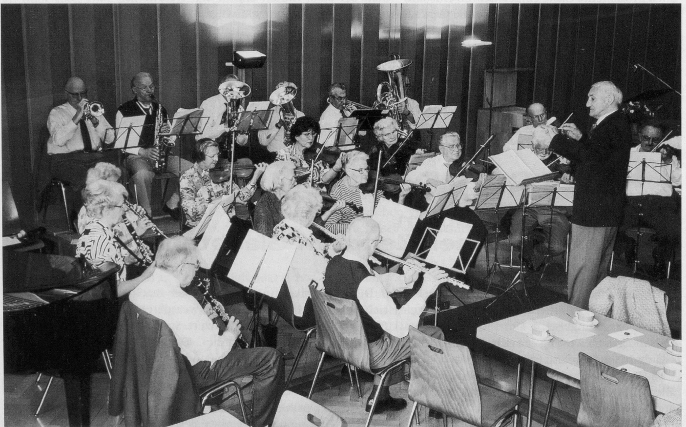
Cello, Piano, Querflöte, Oboe, 2 Klarinetten, 7 Bläser, 9 Violinen: das Senioren-Orchester Zürich