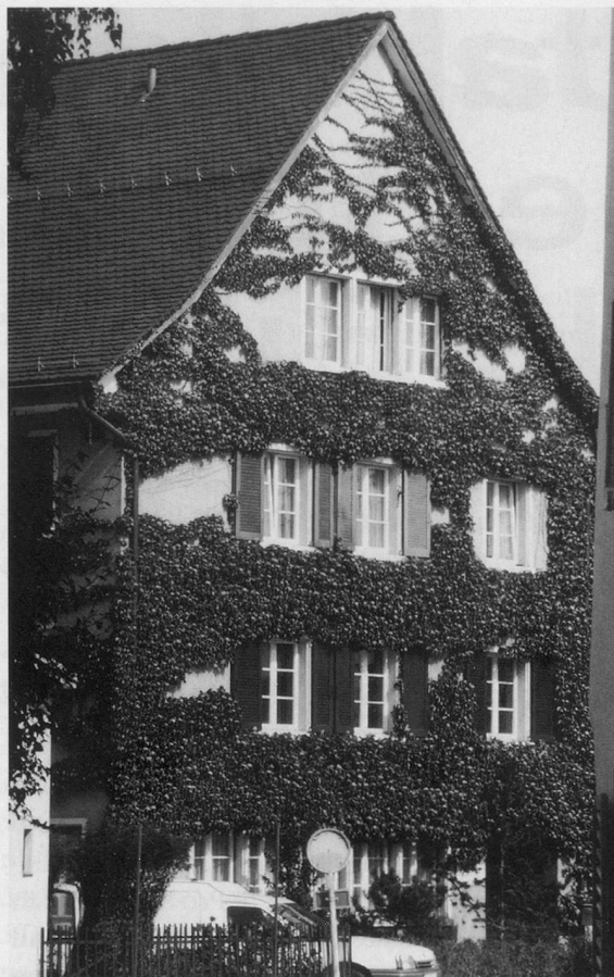
Pro Senectute Kanton Zürich, Zweigstelle Bülach, Hintergasse 1, 8180 Bülach

Liselotte Frei, Zweigstelle Bülach, Pro Senectute Kanton Zürich.