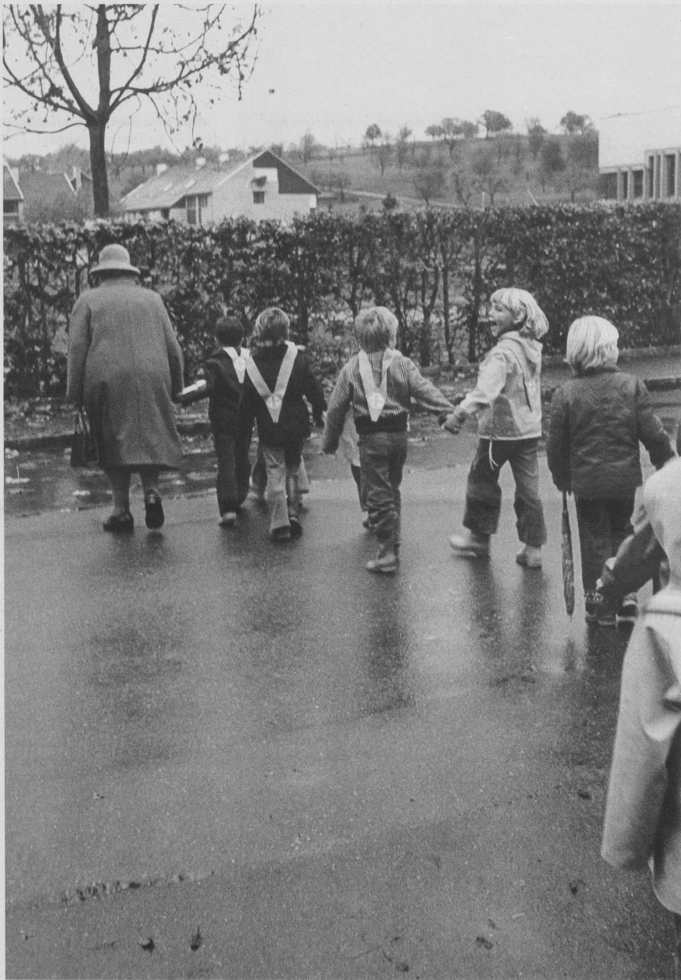
Pro Senectute Kanton Zürich