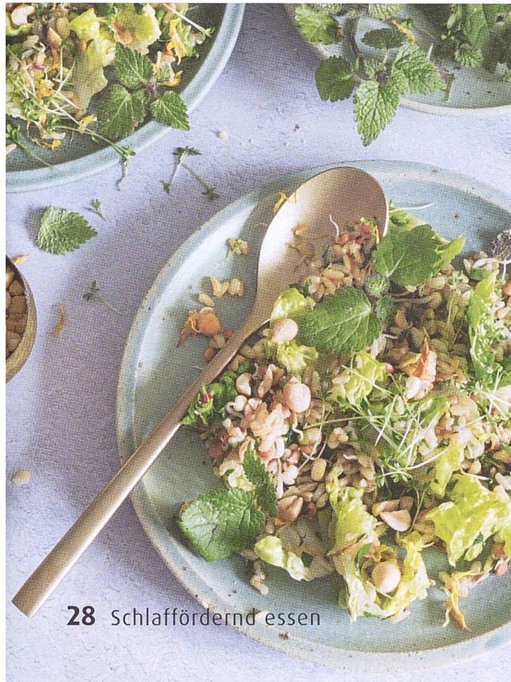
28 Schlaffördernd essen