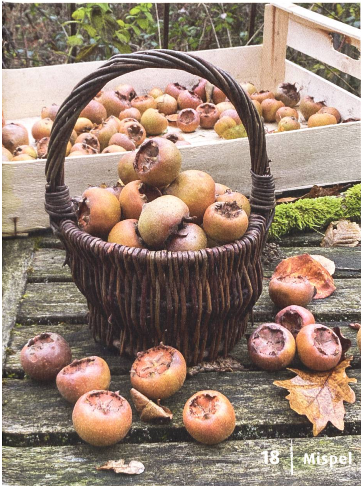
18 | Mispel