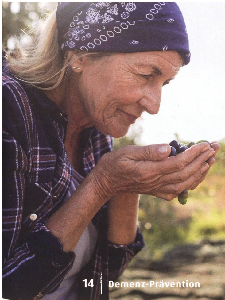
14 | Demenz-Prävention