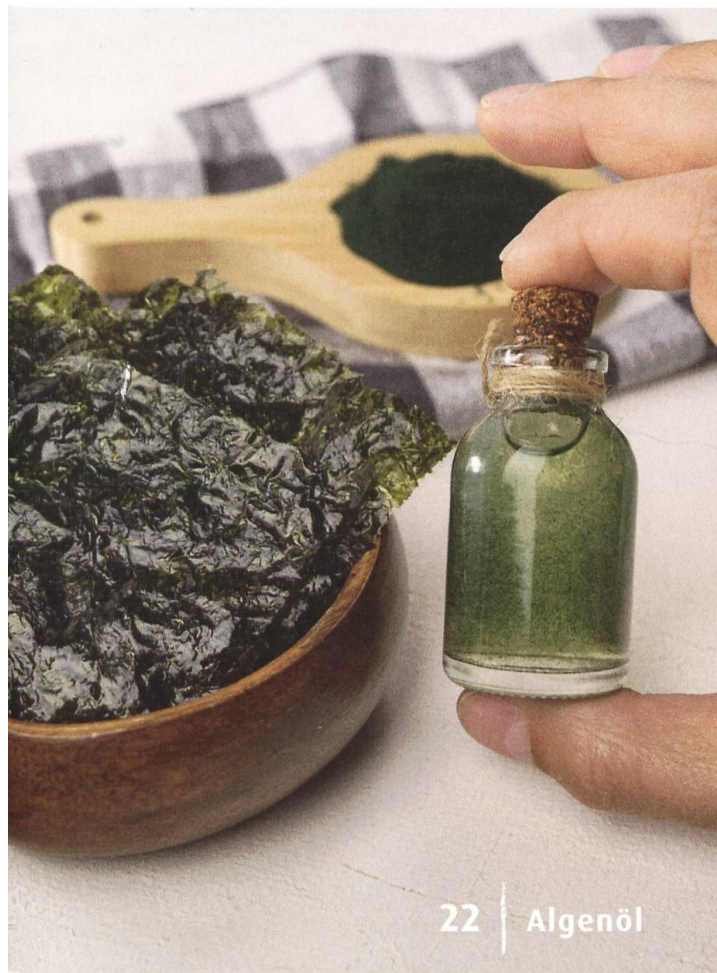
22 | Algenöl