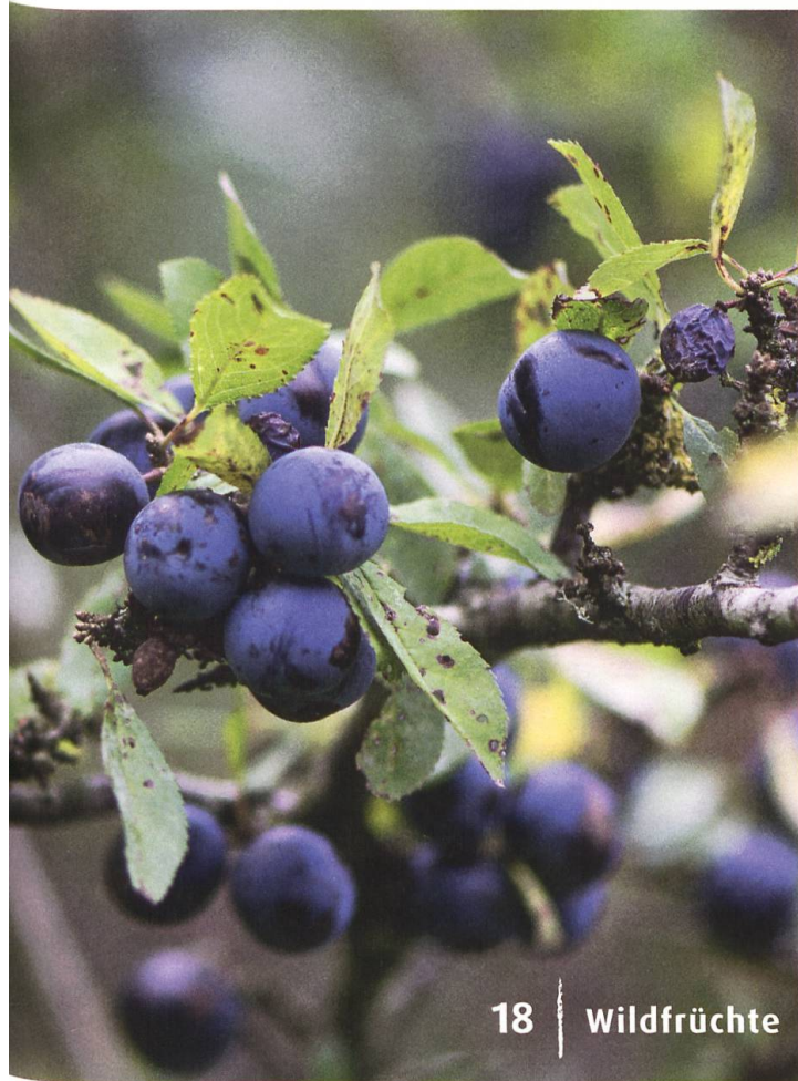
18 | Wildfrüchte