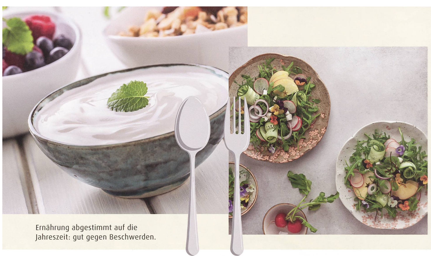
Ernährung abgestimmt auf die Jahreszeit: gut gegen Beschwerden.

Blockaden und Störungen kommen, die wiederum Krankheit auslösen können.