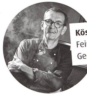
Köstlich zum Nachkochen Feine Rezepte von Georg Reuter