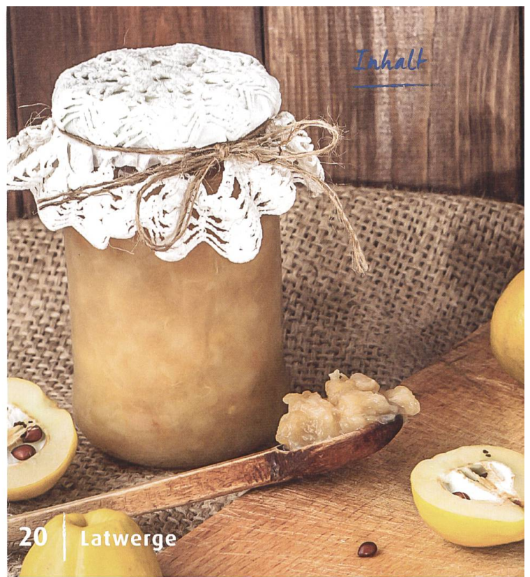
20 | Latwerges