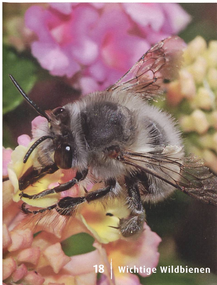
18 | Wichtige Wildbienen