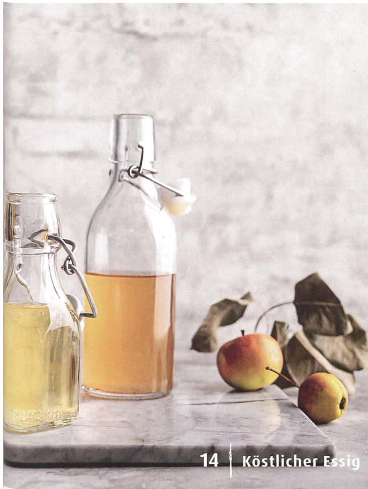
14 | Köstlicher Essig