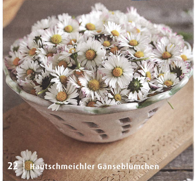
22 | Hautschmeichler Gänseblümchen