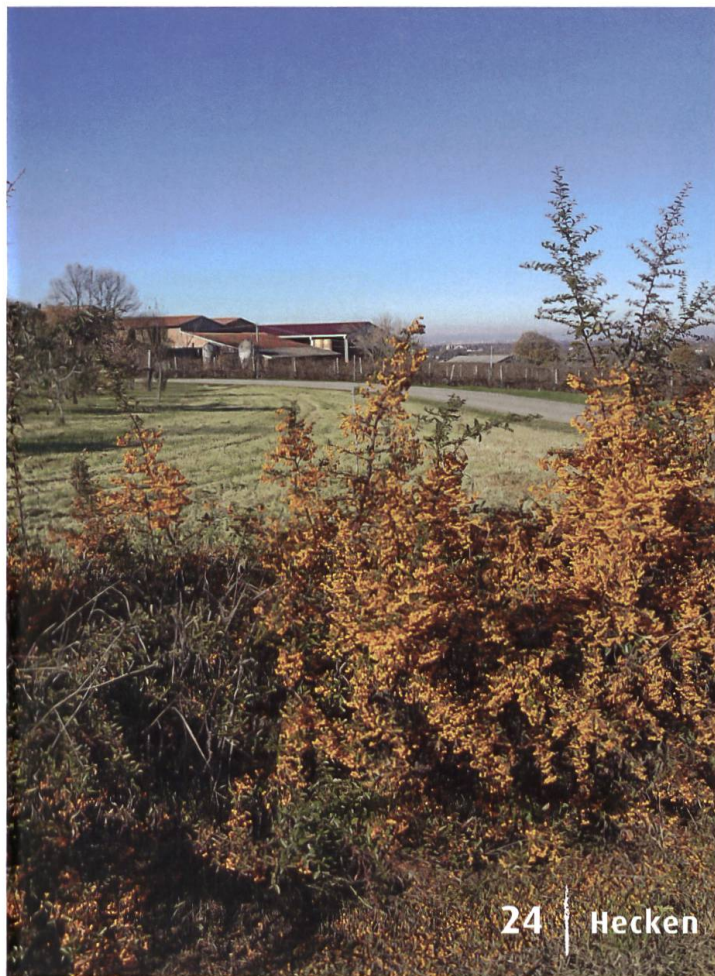
24 | Hecken