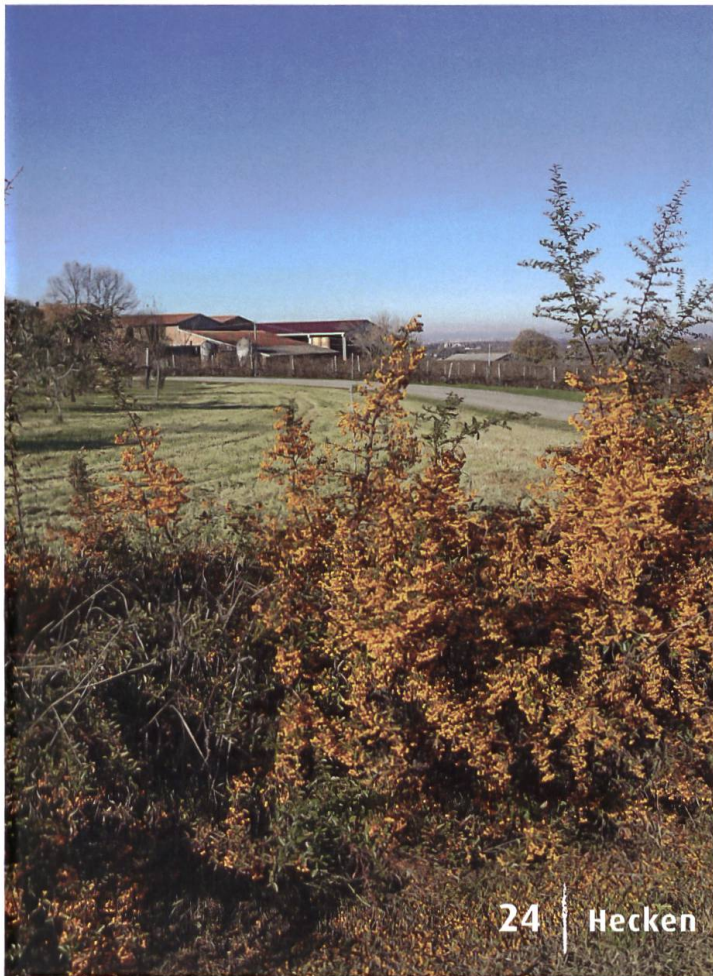
24 | Hecken