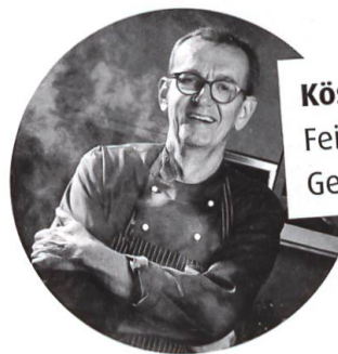
Köstlich zum Nachkochen: Feine Rezepte von Georg Reuter