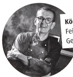
Köstlich zum Nachkochen: Feine Rezepte von Georg Reuter