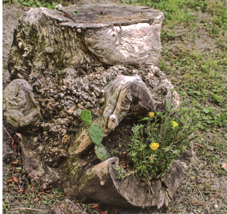
Abgestorbener Baumstumpf als Blumenweide.