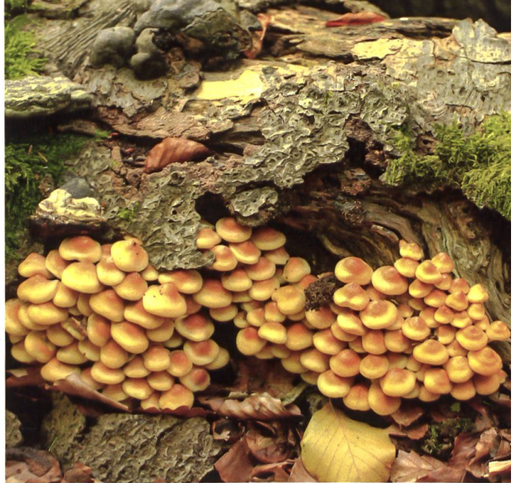
Pilze siedeln sich gerne auf Totholz an.