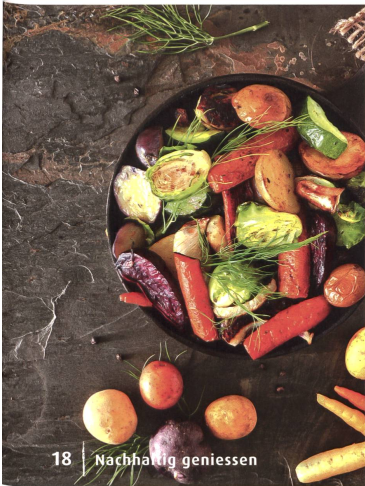
18 Nachhaltig geniessen