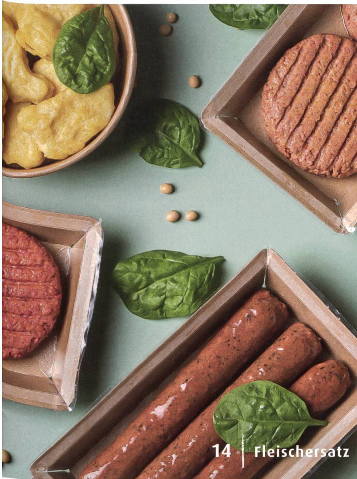
14 | Fleischersatz