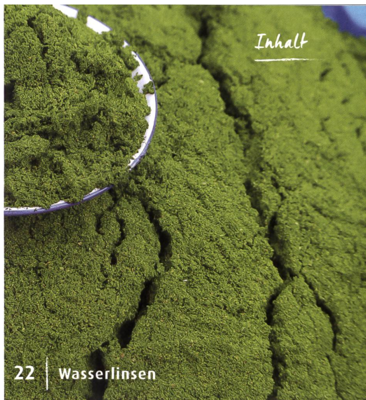
22 | Wasserlinsen

Wasserlinsen könnten das nächste grosse Ding in Sachen gesunde Ernährung werden. Gerade wird intensiv zu Zucht und Einsatzmöglichkeiten der Pflanze geforscht. — Ernährung & Genuss