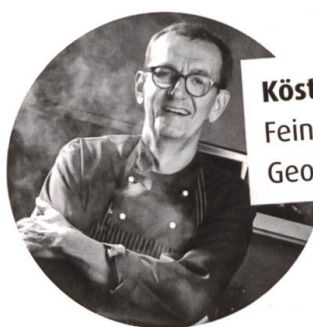
Köstlich zum Nachkochen Feine Rezepte von Georg Reuter