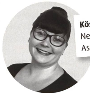
Köstlich zum Nachkochen Neue Rezepte von Assata Walter