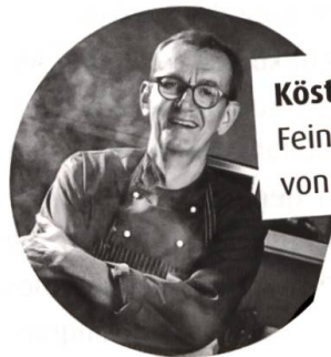
Köstlich zum Nachkochen Feine Rezepte von Georg Reuter