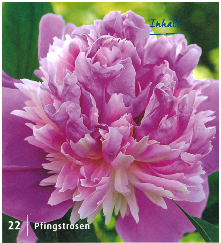
22 | Pfingstrosen

Früher Heilmittel, heute einfach eine tolle Augenweide: Wir betrachten die Pfingstrose mal genauer und tauchen ein in eine Blütenwelt vielfältigster Formen und Farben. — Umwelt & Natur