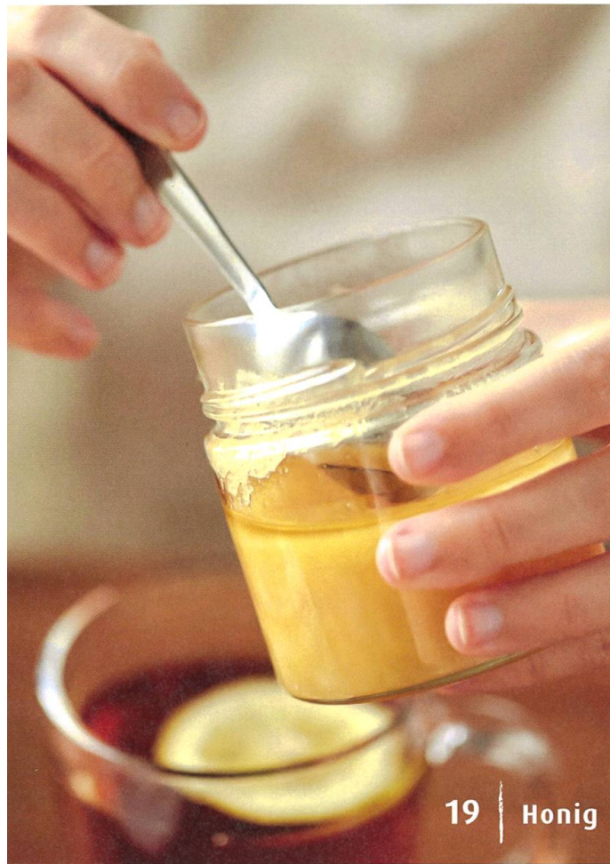
19 | Honig