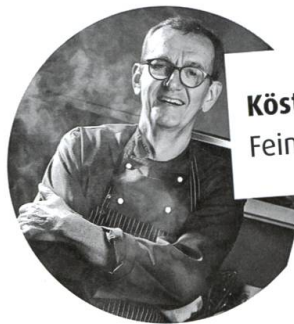
Köstlich zum Nachkochen Feine Rezepte von Georg Reuter