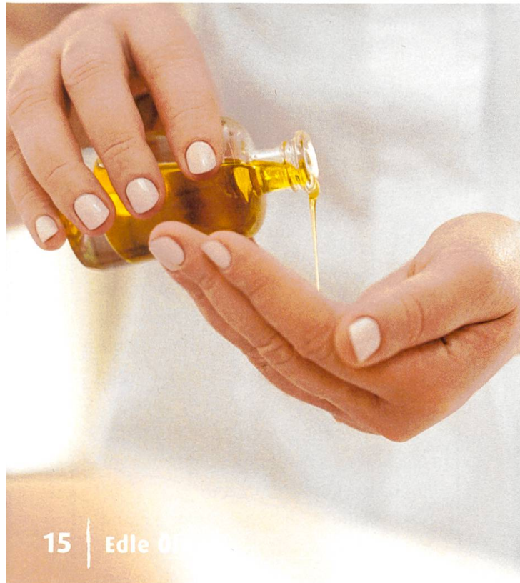
15 | Edle Öle