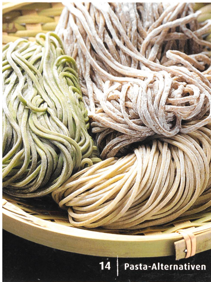
14 | Pasta-Alternativen