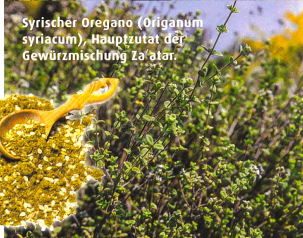
Syrischer Oregano ( Origanum syriacum ), Hauptzutat der Gewürzmischung Za'atar.