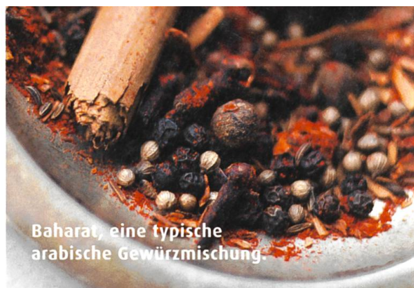
Baharat, eine typische arabische Gewürzmischung.

Baharat ist eine Gewürzmischung aus dem arabischen Raum. Hauptbestandteile sind Kardamom, Koriander, Kreuzkümmel, Nelken, Muskatnuss, Paprika, Pfeffer und Zimt. Wie Curry hat Baharat jedoch keine festgelegte Zusammensetzung, sondern wird in vielen regionalen Varianten verwendet. Er würzt