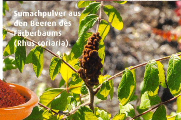
Sumachpulver aus den Beeren des Färberbaums ( Rhus coriaria ).