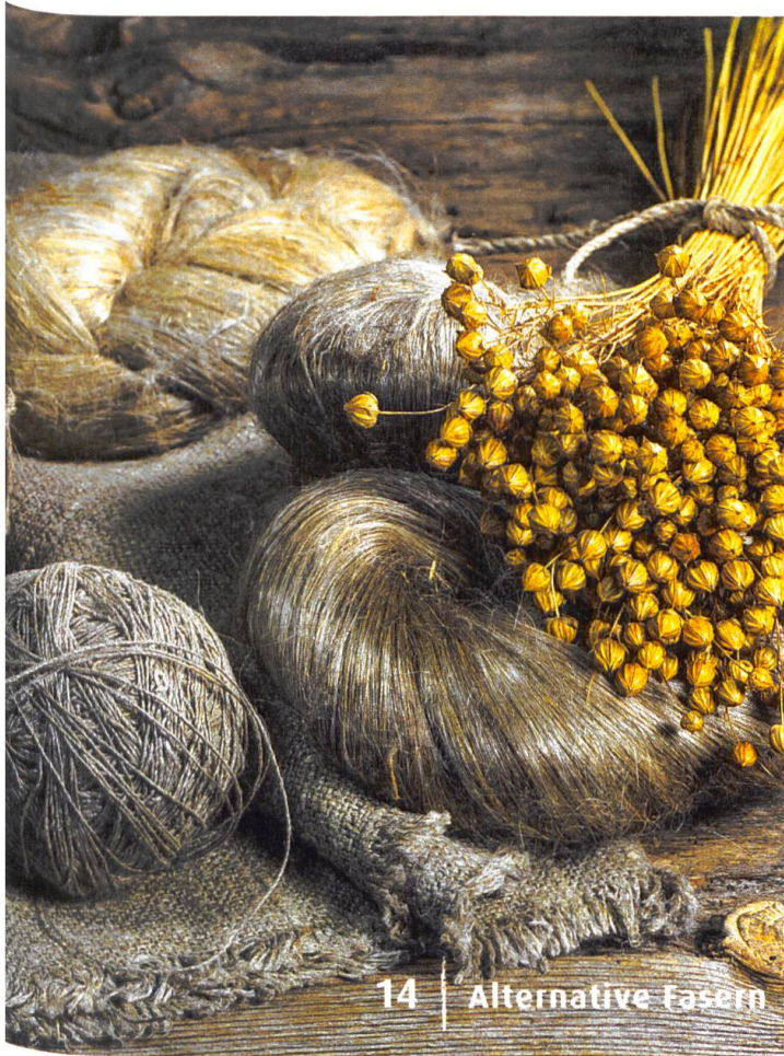
14 | Alternative Fasern