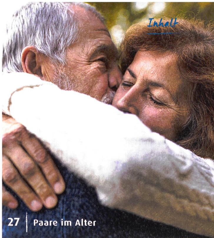
27 | Paare im Alter