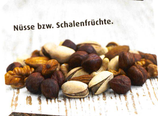
Nüsse bzw. Schalenfrüchte.