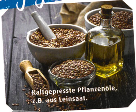
Kaltgepresste Pflanzenöle, z.B. aus Leinsaat.