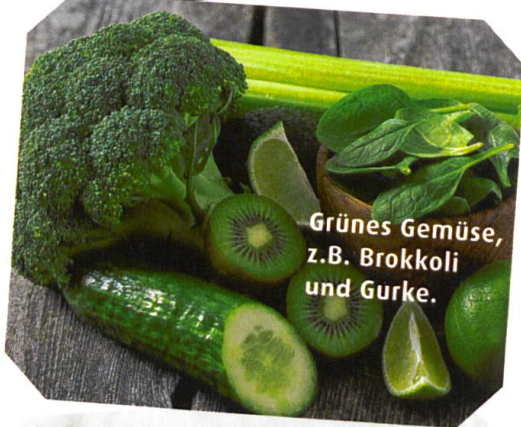
Grünes Gemüse, z.B. Brokkoli und Gurke.