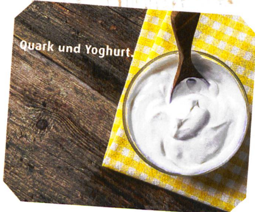
Quark und Yoghurt.

teln, die hautfreundlich wirken und einen tiefen glykämischen Index besitzen. Dazu gehören vor allem Gemüse, Nüsse, Samen und hochwertige Pflanzenöle, zum Beispiel aus Leinsamen, Baumnüssen und Oliven. Hinzu kommt hochwertiges Eiweiss, vor allem in Form von Quark und Frischkäse. Das morgendliche, süss bestrichene Brot ersetzt sie durch Dinkelbrötchen vom Bäcker, und sie backt auch ihr eigenes, weizenfreies Brot. Statt Kuhmilch gibt's Mandelmilch, die täglichen Gemüseportionen werden deutlich erhöht.