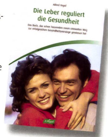
Best.-Nr. 30 broschiert

Die Leber ist lebenswichtig. Wir sollten diesem Entgiftungsorgan darum besondere Aufmerksamkeit schenken. Was eine erfolgreiche Leberpflege ausmacht, welche Heilpflanzen dabei unterstützen und was sich allein schon durch den richtigen Speiseplan bewirken lässt, verrät Alfred Vogels Leitfaden «Die Leber reguliert die Gesundheit» .