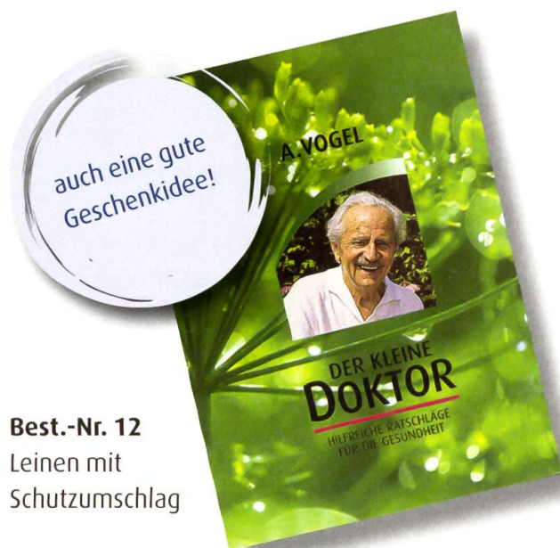
Best.-Nr. 12 Leinen mit Schutzumschlag

Herbst und Winter sind ideal, um mal wieder ein Buch zur Hand zu nehmen und das Wissen über gesunde Lebensführung aufzufrischen. Zwei Klassiker aus dem Verlag A.Vogel sollten in keinem Haushalt fehlen.