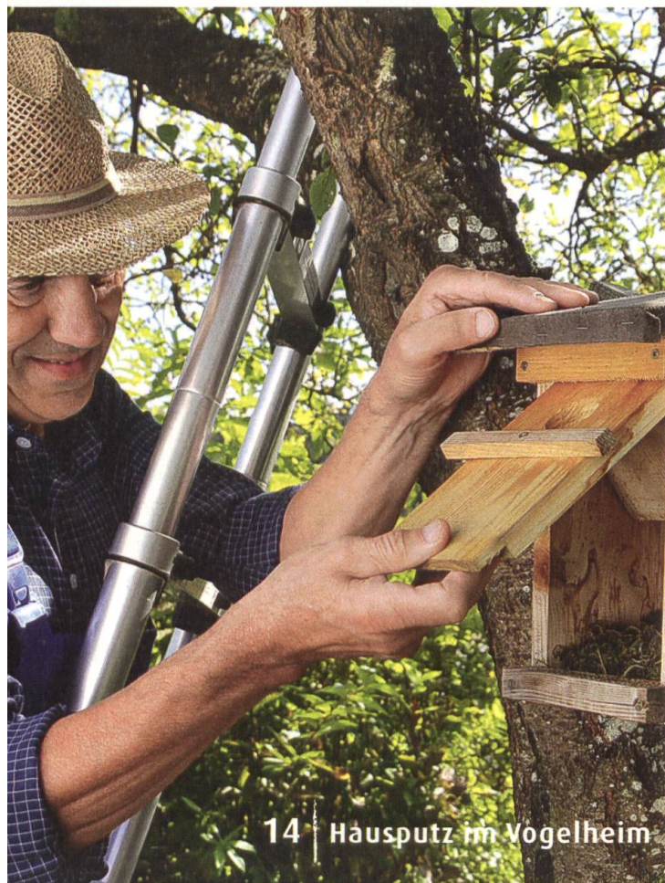
14 | Hausputz im Vogelheim