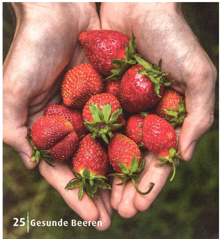
25 | Gesunde Beeren