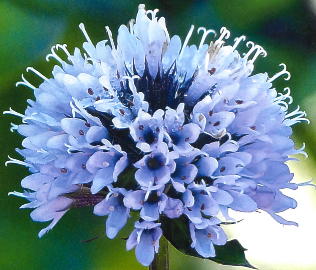
Die Welt der Kräuter und Gewürze: Die Minze (Mentha) gilt als eine der beliebtesten Heilpflanzen; wichtigster Wirkstoff ist ihr ätherisches Öl. Sie blüht im Spätsommer und erfreut mit lila Blüten.